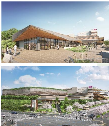
A街区 外観イメージ